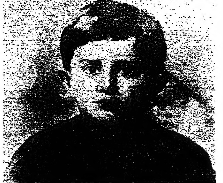
جنبلاط في السادسة من عمره

واصبح من قادة الثورة على عهد الرئيس شمعون عام 1958 مشتركا في ذلك مع زعماء السنة في طرابلس وبيروت ،